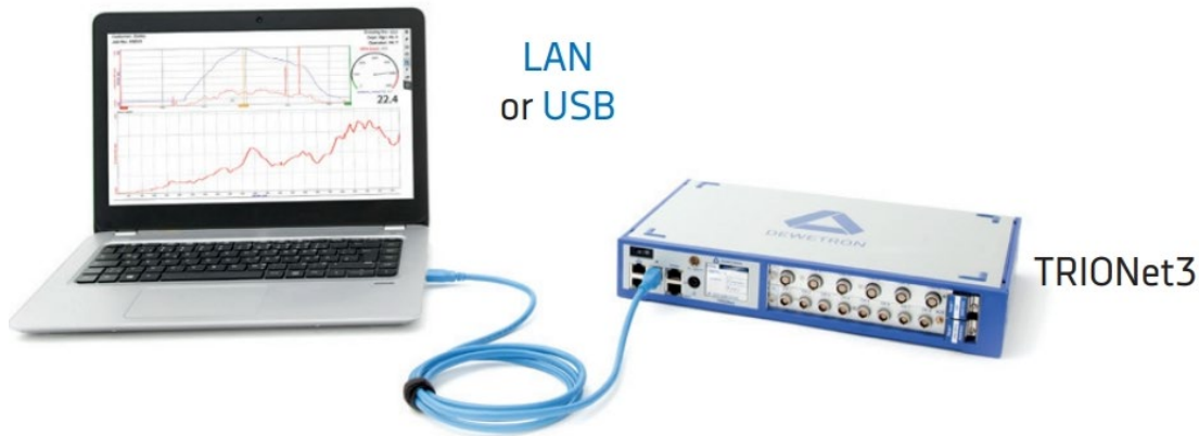
图 2 数据采集系统配合电脑使用

设计则强调对高速信号的实时捕捉，在长时间监测和大规模数据分析方面存在一定限制。因为示波器的处理器通常内置在设备中，处理能力相对较弱。为了减轻设备在高速数据处理中的负担，示波器通常采用较低的位深，这有助于降低处理数据的压力，同时确保系统能够高效处理高速采样的数据。