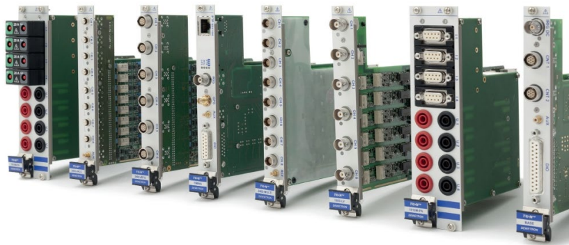
图 3 多通道数采板卡

通道数: 通道数决定了数据采集系统可以同时测量的独立信号数量。更多的通道数允许同时监测多个信号源，提高测试效率，满足复杂测试场景的需求。例如，在电力系统测试中，可能需要同时测量多条线路的电压和电流信号。