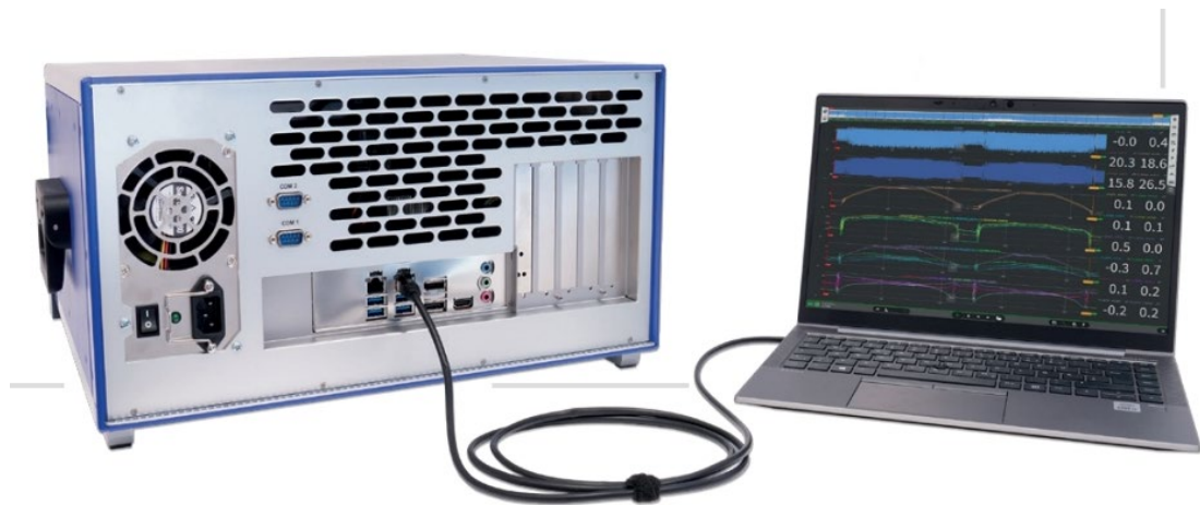
图 1 数采系统搭配电脑使用

在现代工业和科研领域，数据采集系统 (DAQ) 扮演着关键角色，它们用于从物理世界获取数据，以供分析和处理。为了确保数据采集系统的性能满足特定应用的需求，了解其核心参数至关重要。本文将围绕采样率、位深、输入范围、精度、隔离电压、通道数、滤波器特性以及总谐波失真和信噪比这九个关键参数，详解它们的作用。